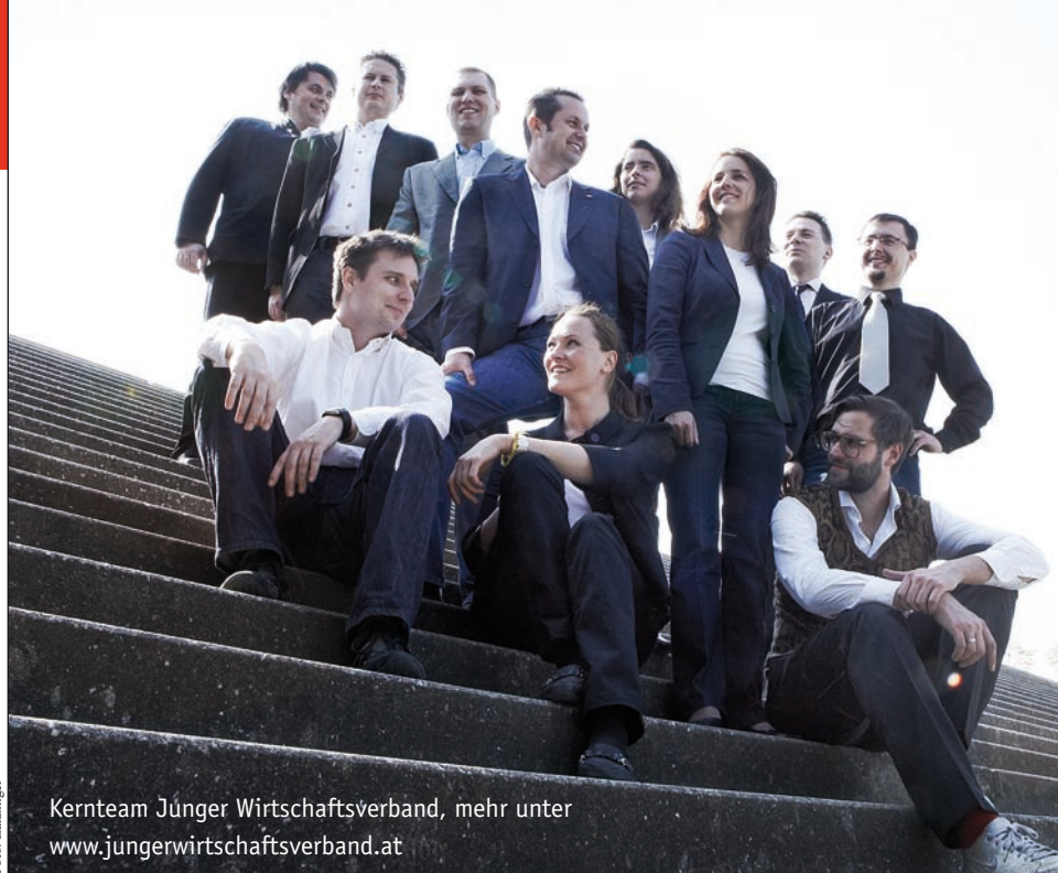
Kernteam Junger Wirtschaftsverband, mehr unter www.jungerwirtschaftsverband.at

Der nächste(n) KMU-Gipfel findet im Juni statt, alle Veranstaltungen finden Sie im Veranstaltungskalender: www.kmugipfel.at (emh)